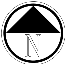
PLANIMETRIA GENERALE Scala 1:500