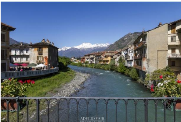
La Dora Riparia