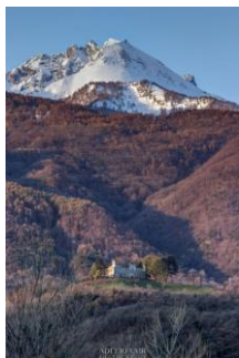
Versante sud della valle: veduta di Castel Borello

Numerosi itinerari di SCIALPINISMO sono inoltre descritti e ben documentati sul sito web del Comune di Bussoleno, nelle AREE TEMATICHE , alla voce Itinerari , contenente anche IMMAGINI dei percorsi nella GALLERIA ITINERARI DI SCIALPINISMO (a cura di Giovanni Vighetti), es.: