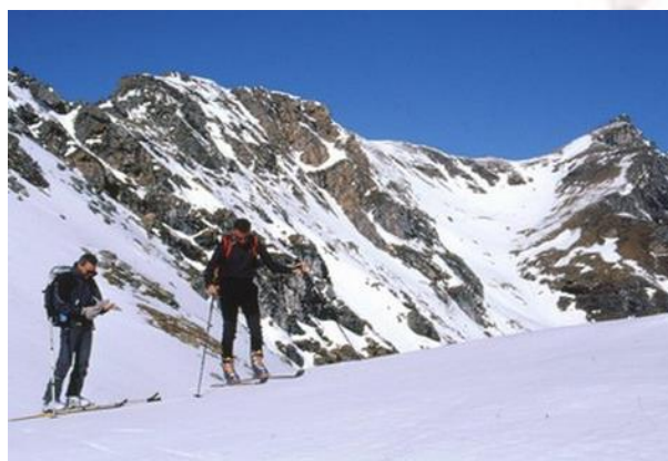
Giro dei Tre Colli - Colle del Sabbione 2560 m – sullo sfondo a dx Punta Rocca Nera

(Una descrizione più accurata del percorso è presente nelle pagine web, come già indicato).